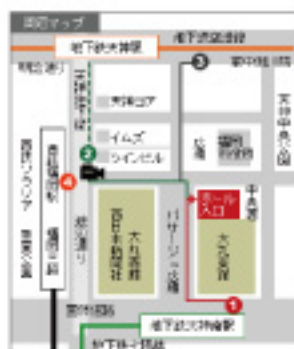
エルガーラホール アクセスマップ